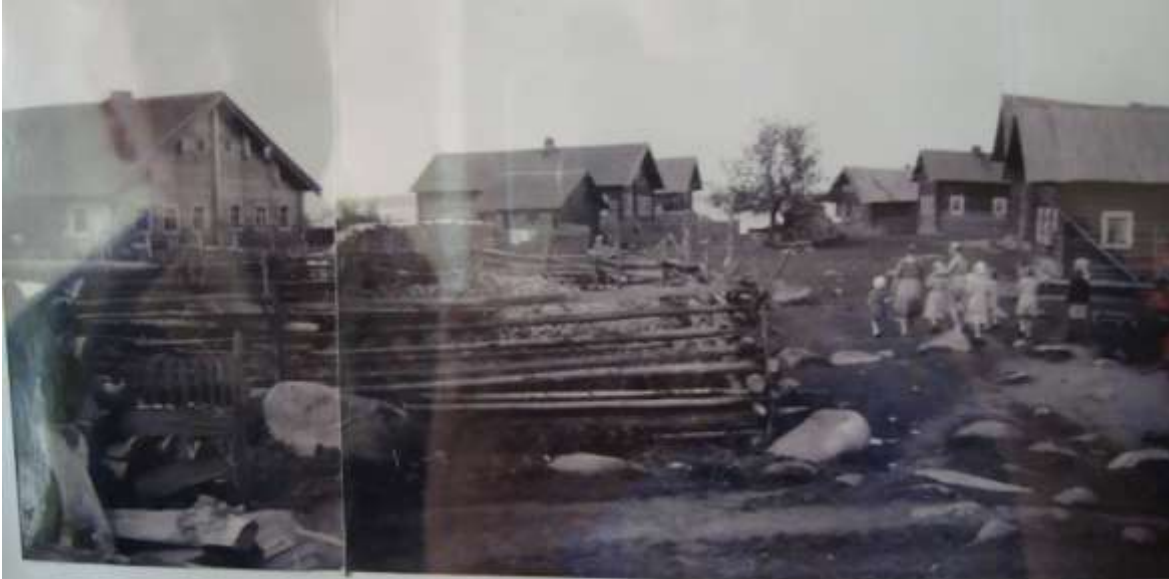
д. КИБРА, 1960 г.